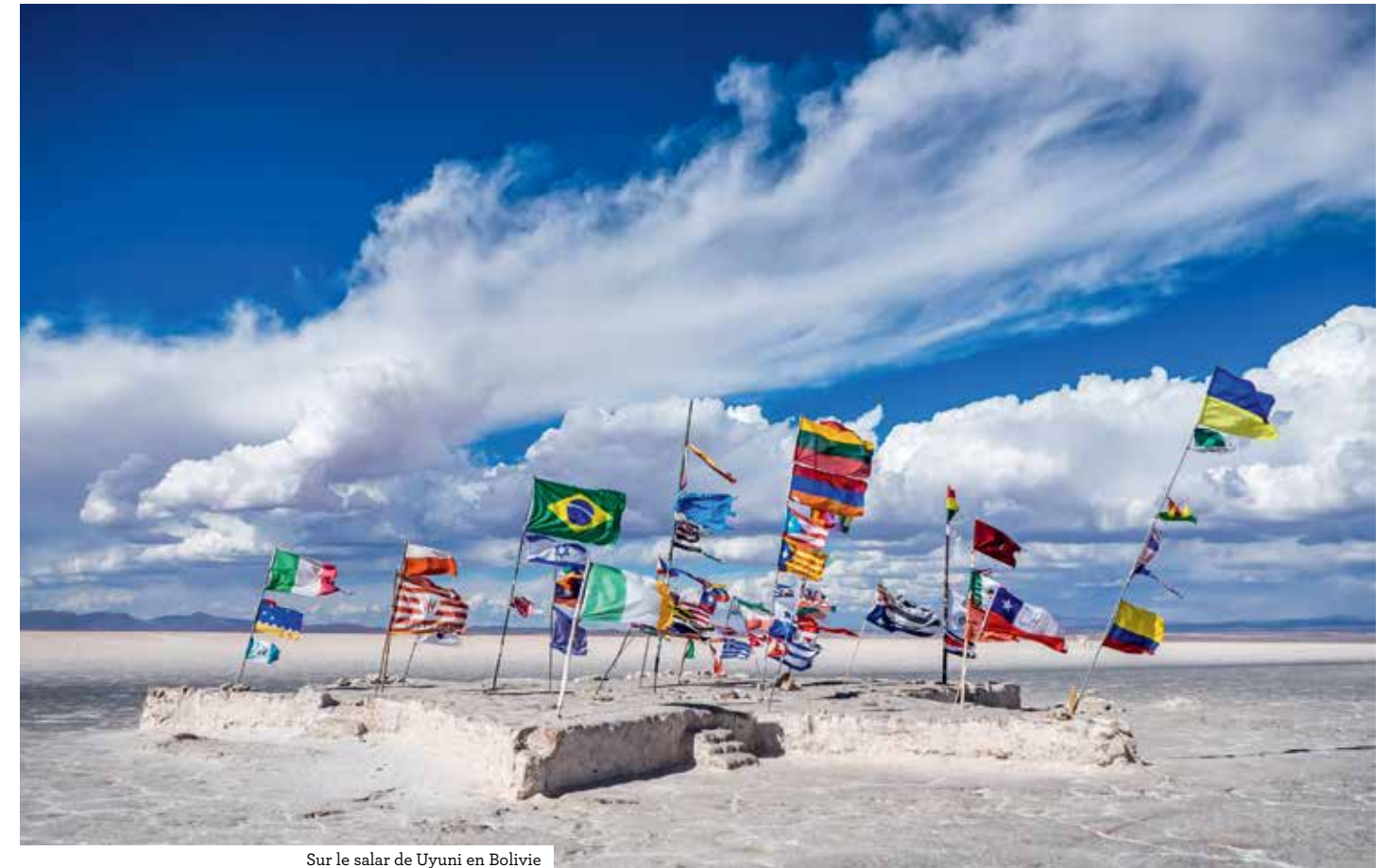
Sur le salar de Uyuni en Bolivie

Rando, découverte classique, thématiques culturelles... On dénombre sur le site une centaine de voyages sur trente destinations, encadrés par des guides locaux. Pour les célibataires avec ou sans enfant, des circuits itinérants, ainsi que des thématiques culturelles, musicales,