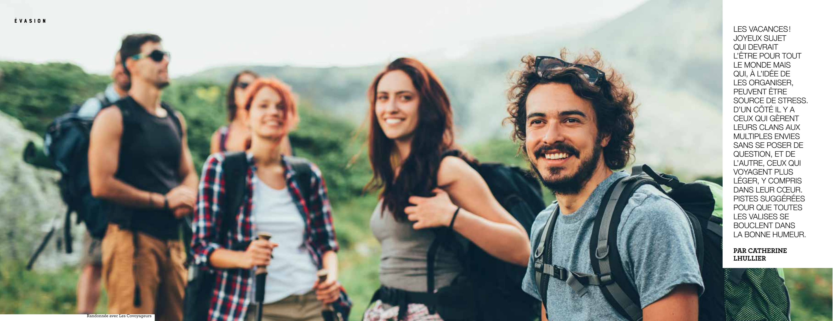
Randonnée avec Les Covoyageurs

LES VACANCES! JOYEUX SUJET QUI DEVRAIT L'ÊTRE POUR TOUT LE MONDE MAIS QUI, À L'IDÉE DE LES ORGANISER, PEUVENT ÊTRE SOURCE DE STRESS. D'UN CÔTÉ IL Y A CEUX QUI GÈRENT LEURS CLANS AUX MULTIPLES ENVIES SANS SE POSER DE QUESTION, ET DE L'AUTRE, CEUX QUI VOYAGENT PLUS LÉGER, Y COMPRIS DANS LEUR CŒUR. PISTES SUGGÉRÉES POUR QUE TOUTES LES VALISES SE BOUCLENT DANS LA BONNE HUMEUR.