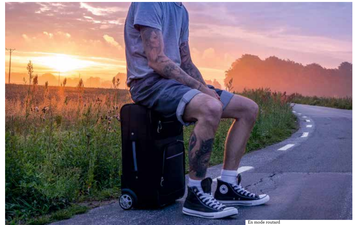
En mode routard