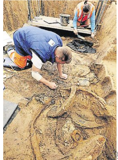
Les archéologues ont mis au jour une sépulture au contenu exceptionnel.

Pour lui, ce type de tombes dites « à char », notamment chez les Rèmes qui occupaient l'actuelle Champagne-Ardenne, émerge vers -700 et dure jusqu'à la fin de la période gauloise, au début de notre ère. Ici, la sépulture daterait du I er siècle avant Jésus-Christ. Pour preuve,