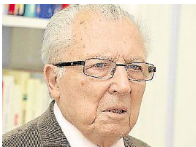
Jacques Delors et Lionel Jospin interpellent François Hollande.