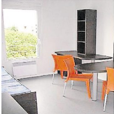
Au choix, un couvent italien, une résidence étudiante à Nîmes ou de la co-navigation au départ du port de Dahouët.

75 villes à travers le monde proposent cette formule : Rome, Istanbul, Barcelone, Paris mais aussi Aix, Nice, La Rochelle, Clermont-Ferrand... À partir de 30 € pour une chambre double. Rendez-vous sur le site universityrooms.com .